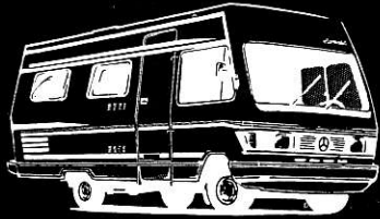
RM 35 L