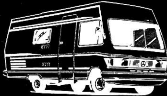
RM 35 S