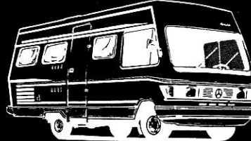
RM 38 L